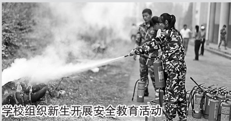
学校组织新生开展安全教育活动

为了更好地增强大学生的安全意识,掌握安全技能,我校在新生入学教育中,深入开展了一系列的安全教育活动。内容有:举办安全培训暨安全知识教育竞赛活动、宣传安全知识、开展安全演练、张贴大型禁毒宣传海报、举办仿真毒品展和师生禁毒签名活动,提醒广大青年学子重视安全,远离危害,拥有美好健康向上的人生。