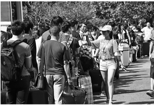
以上图片为迎新当天校园里忙碌的画面。