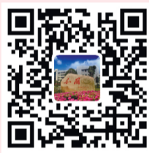
台职院官方微博二维码